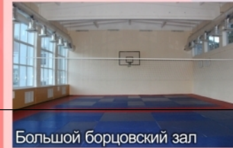
Большой борцовский зал